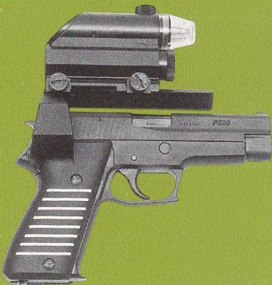
SIG/SAUER P 220