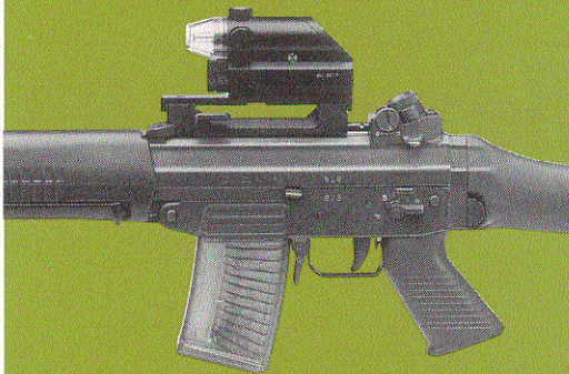
SIG SG 550

* Traser-Kaltlichtzelle von mb-microtec Ltd.