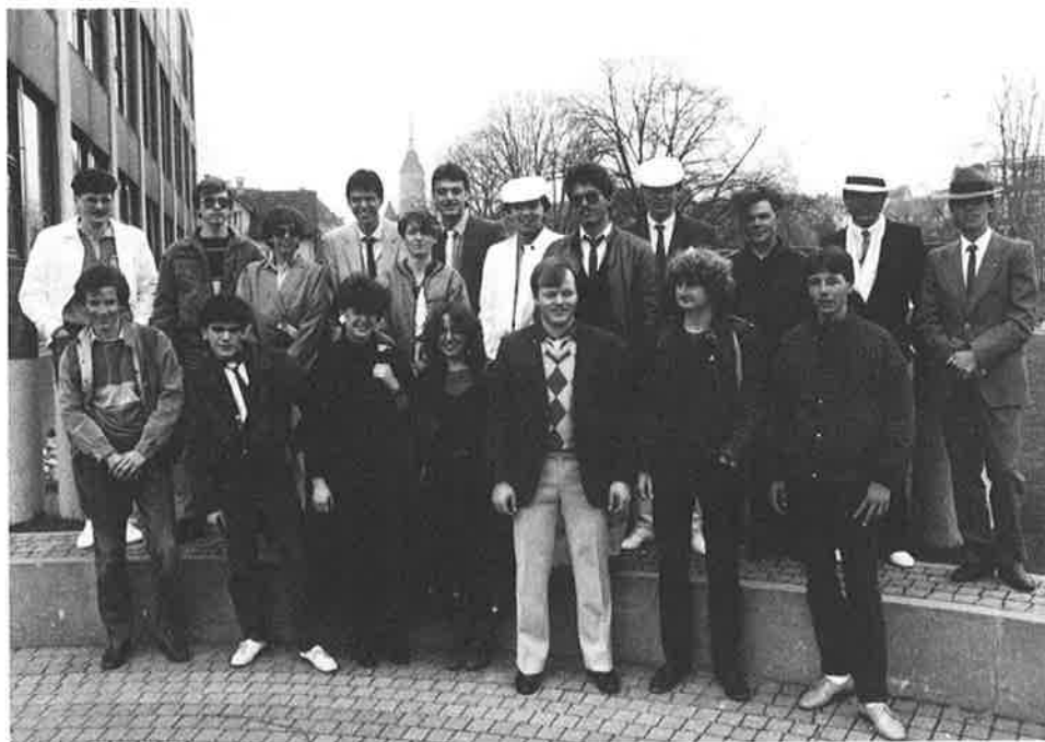
Abbildung oben: Die Erfolgreichsten auf einen Blick: sie erhielten die interne Auszeichnung!

Abbildung unten: Alle beisammen: Lehrabschlussjahrgang 1984!